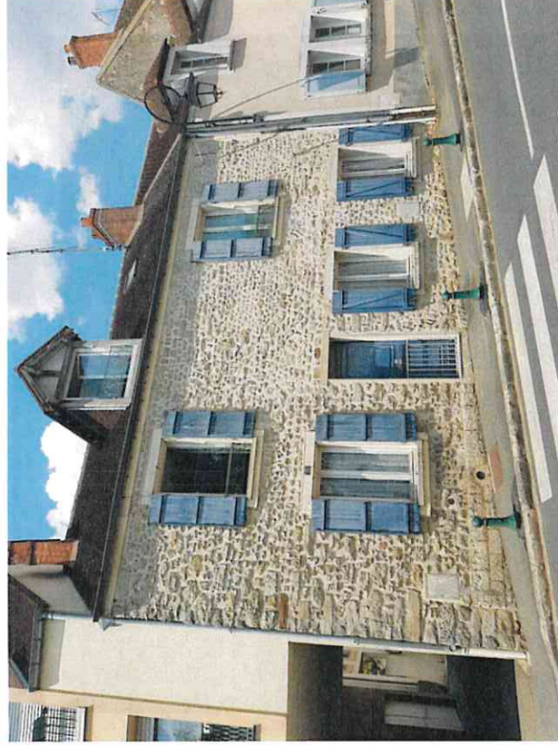
Maison de ville traditionnelle en pierres de taille apparentes.

7, Rue de l'Hôtel de Ville 91590 LA FERTE ALAIS N°Parcelle Cadastrale : 235