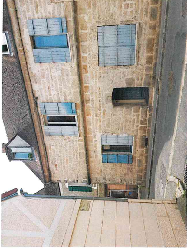
Maison de ville traditionnelle en pierres de taille apparentes. Encadrement de porte en pierres de taille du 12e. Noyau centre ville