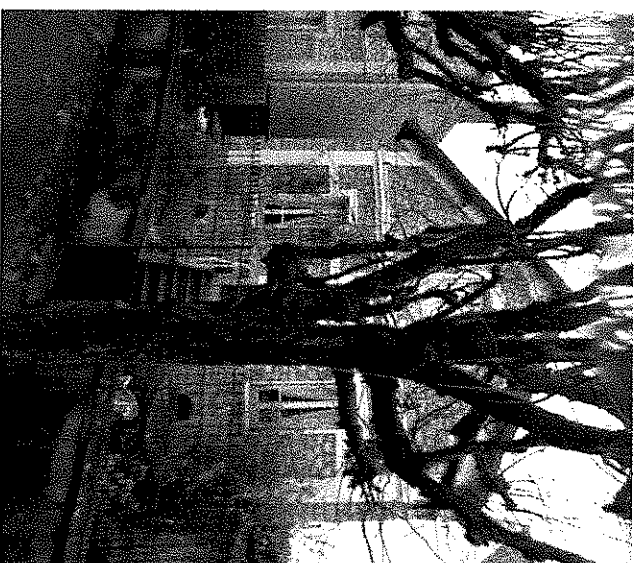
Maison de ville bourgeoise traditionnelle en pierres apparentes de type meunières. Encadrements de fenêtres, gardes-corps, corniches caractéristique fin 19e – début 20e siècle.